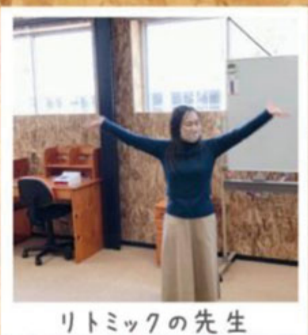
リトミックの先生